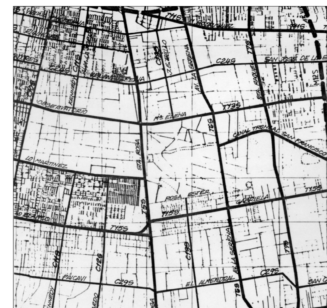
VIALIDAD ESCALA 1/50000 (según plano RM-PRM-92/1A1)