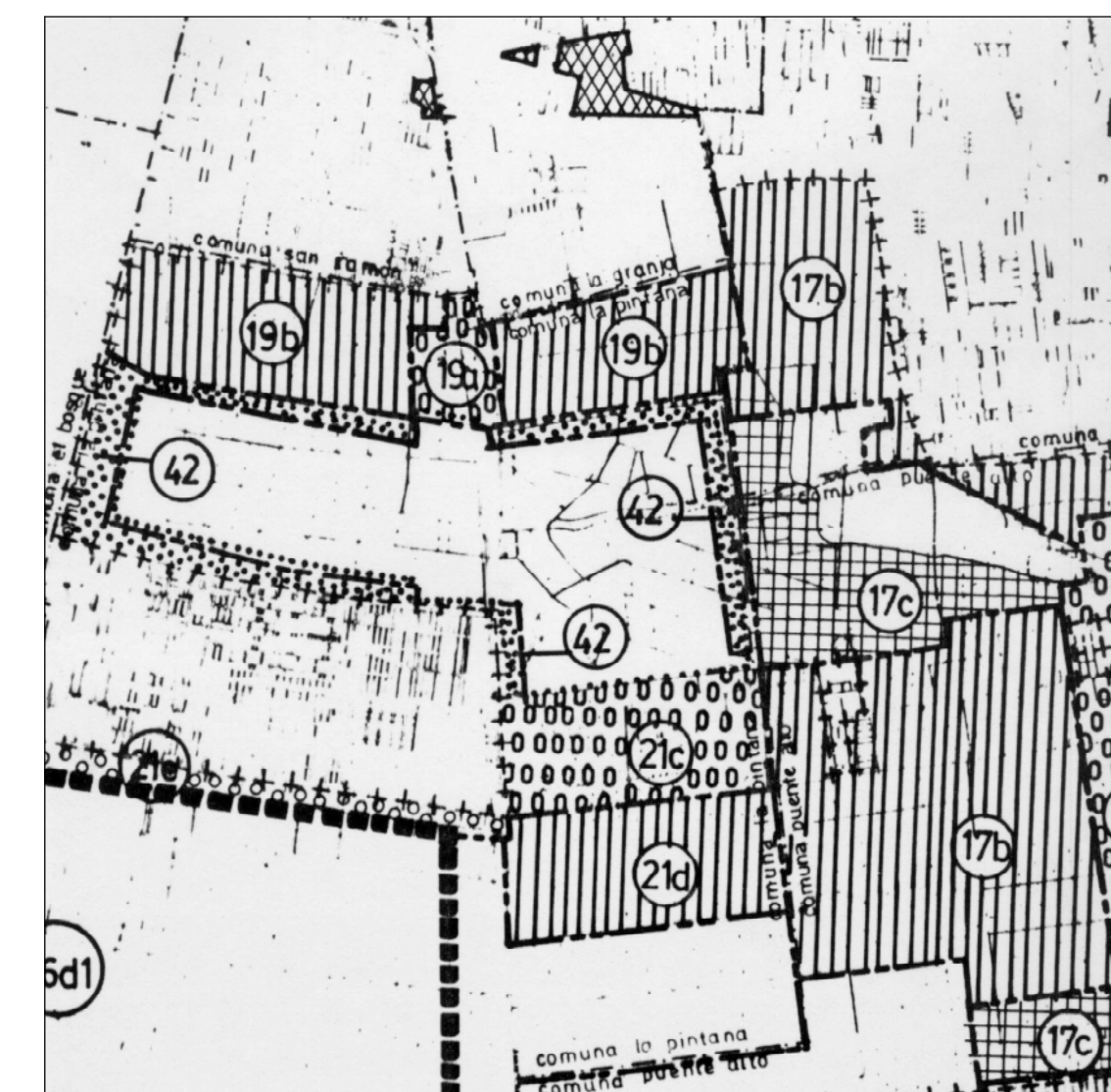
NORMAS TRANSITORIAS ESCALA 1/50000 (según plano RM-PRM-93/T)