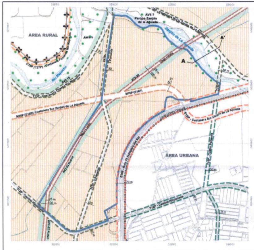
IMAGEN N°1 SUPERPOSICION DEL PREDIO SOBRE VIALIDAD PRMS ACTUAL

Mediante la presente, le escribo en representación de la empresa Consorcio, cuyo predio se encuentra individualizado en imagen 1 de la presente carta, el cual se encuentra gravemente afectado por la vialidad planificada inscrita en la propiedad.